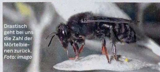
Drastisch geht bei uns die Zahl der Mörtelebienen zurück.

» parasitäre Arten ins Hintertreffen, vermehren sich ihre Antipoden ungebremst. Das Ökosystem verliert sein fragiles Gleichgewicht. Leider bedürfte es noch intensiver Forschung, um diese Zusammenhänge im Detail zu verstehen. Sind Schlupfwespen – weltweit gibt es allein 40 000 Arten – und andere Wespenarten nicht mehr vorhanden, fällt eine natürliche Schädlingsbekämpfung aus.