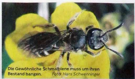
Die Gewöhnliche Schmalbiene muss um ihren Bestand bangen.