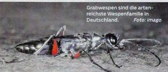
Grabwespen sind die artenreichste Wespenfamilie in Deutschland.