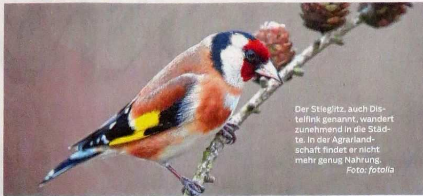
Der Stieglitz, auch Distelfink genannt, wandert zunehmend in die Städte. In der Agrarlandschaft findet er nicht mehr genug Nahrung.