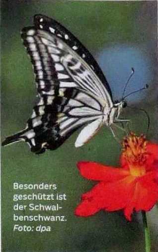
Besonders geschützt ist der Schwalbenschwanz.