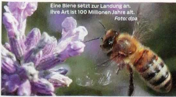
Eine Biene setzt zur Landung an. Ihre Art ist 100 Millionen Jahre alt.