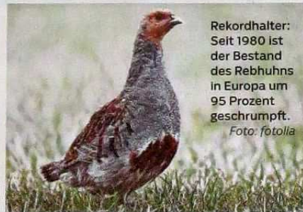
Rekordhalter: Seit 1980 ist der Bestand des Rebhuhns in Europa um 95 Prozent geschrumpft.

Natur Das Vogelzwitschern und Bienensummen nimmt ab. Biologen warnen vor einer insektenfreien Landschaft. Von Martin Hofmann