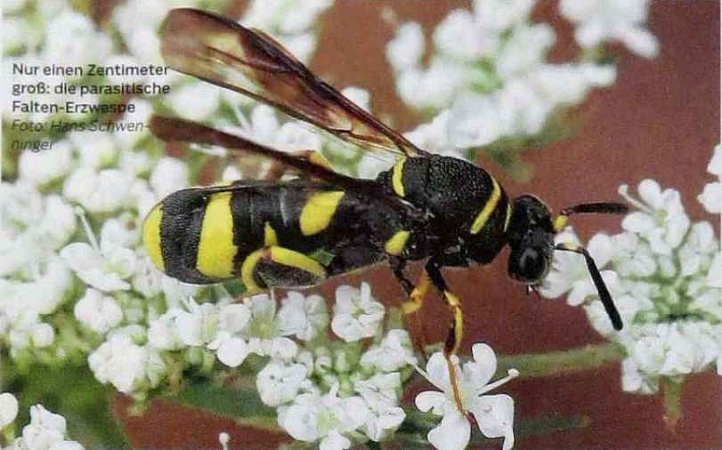
Nur einen Zentimeter groß: die parasitische Falten-Erzwespe.