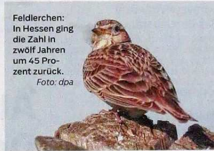
Feldlerchen: In Hessen ging die Zahl in zwölf Jahren um 45 Prozent zurück.