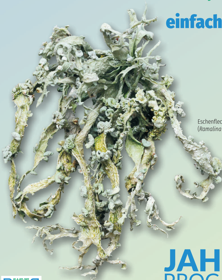
Eschenflechte ( Ramalina fraxinea )